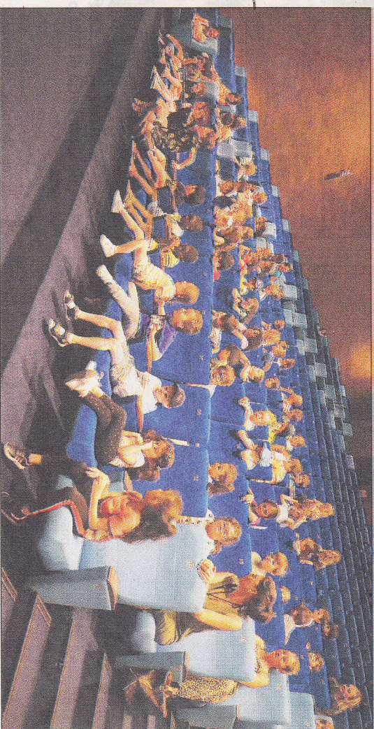
Les enfants ont pu assister à une pièce de théâtre en langue corse.

Au total, ce sont plus de 10 400 élèves pour 520 classes qui ont participé à ce prix, soit 92 % des écoles des territoires de l'intérieur de l'île. Le but recherché ? Promouvoir le théâtre en langue corse auprès des jeunes publics, et permettre aux enfants d'assister à des représentations de spectacle vivant dans des lieux de diffusion au sein de leur territoire : « L'objectif est double , confie Antonia Luciani, conseillère exécutive de la Collectivité de Corse en charge