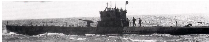
Un esemplare di Regio Sommergibile.

Il viaggio verso Pola fu nuovamente massacrante e Nanè, un po' per il freddo preso all'interno dei vagoni della tradotta, un po' per le correnti d'aria che si formavano nelle continue fermate, arrivò a destinazione con qualche linea di febbre. Ma ciò che lo snervò non fu la temperatura corporea, quanto la notizia che il suo nome era in elenco fra i marinai che tra due giorni dovevano