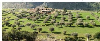
Veduta attuale della masseria in contrada 'Çièusu', con l'impianto di uliveto.

La famiglia, ma sarebbe meglio dire la 'famigliona' per via del rilevante numero dei componenti, non godeva di alcuna proprietà terriera. Il padre aveva preso in affitto un