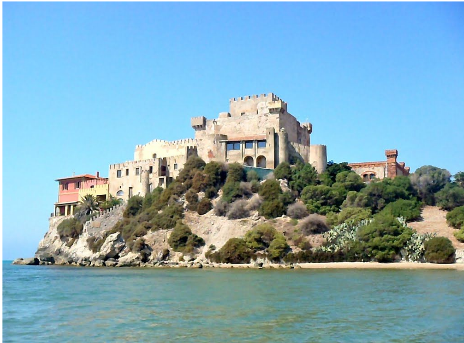
Castello di Falconara - Butera (CL)

periodico fondato nel 1988 dall'ASSOCIAZIONE CULTURALE SICILIA FIRENZE