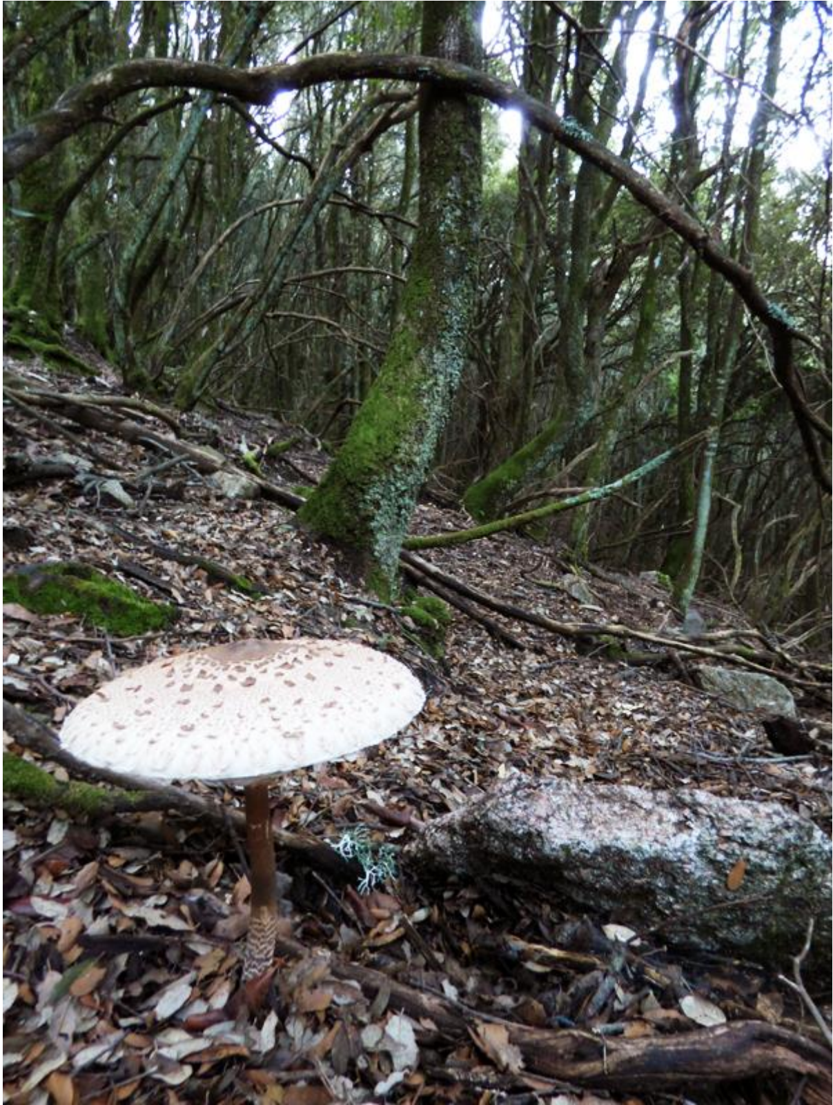
• Una culumbella