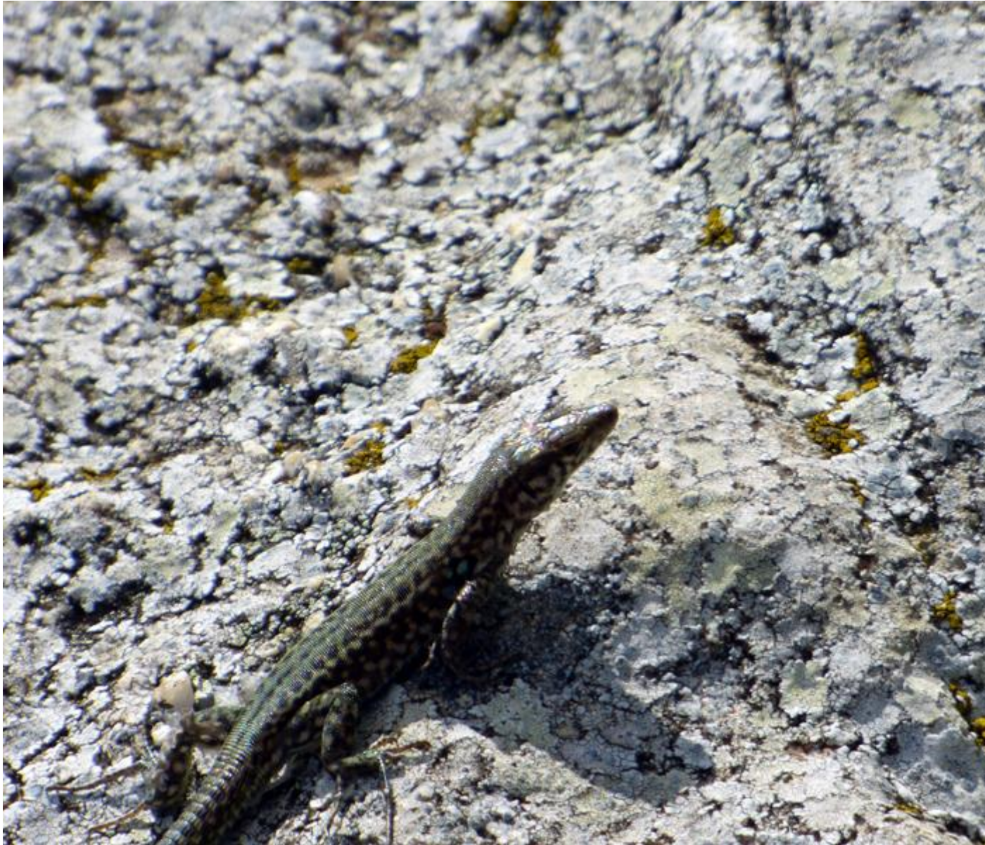
• Una buciartula