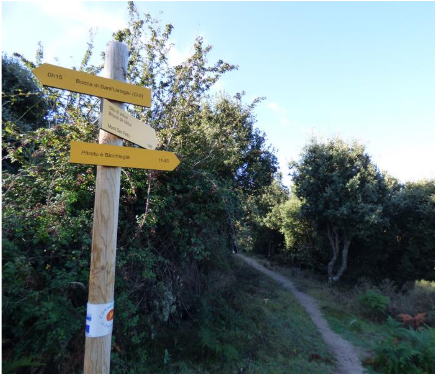
• Si incrocianu u chjassu di u paese è l'altu di A Bocca à Sant'Eustace