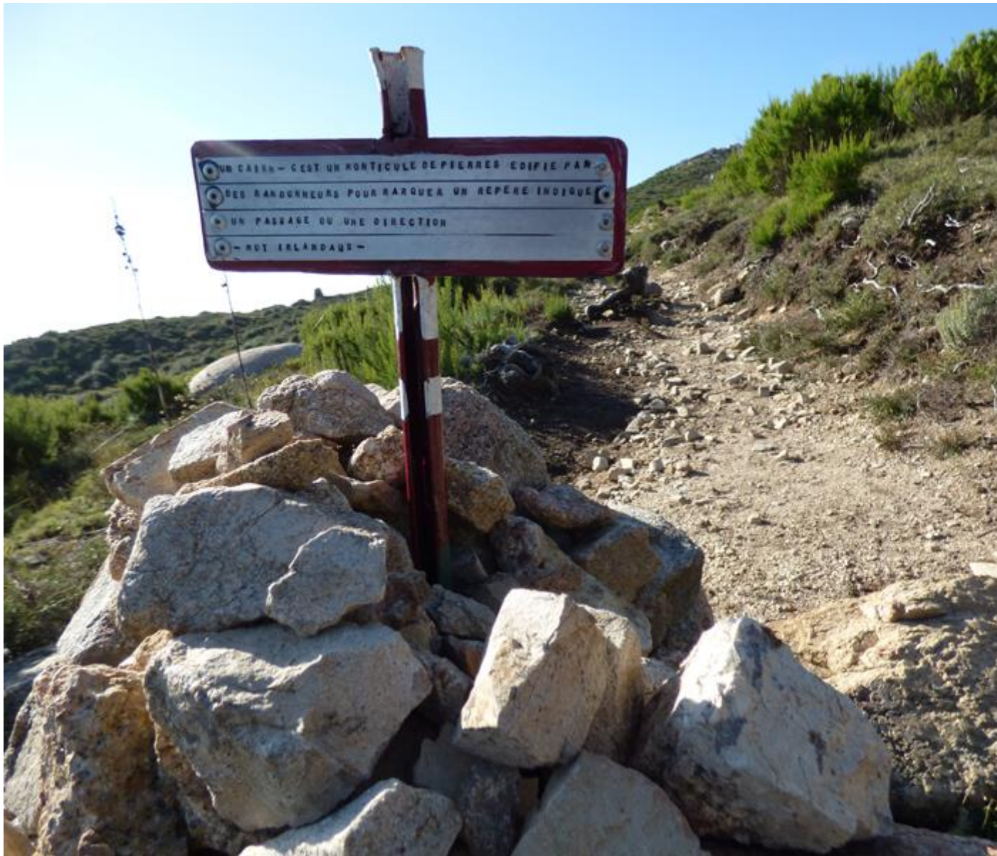
• Di quandu in quandu, picculi pannelli in ferru ficcati in pianu