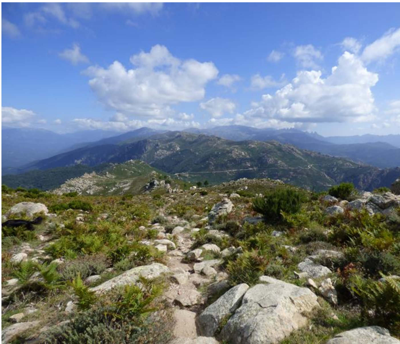
• Ritornu ver'di A Bocca à Sant'Eustace