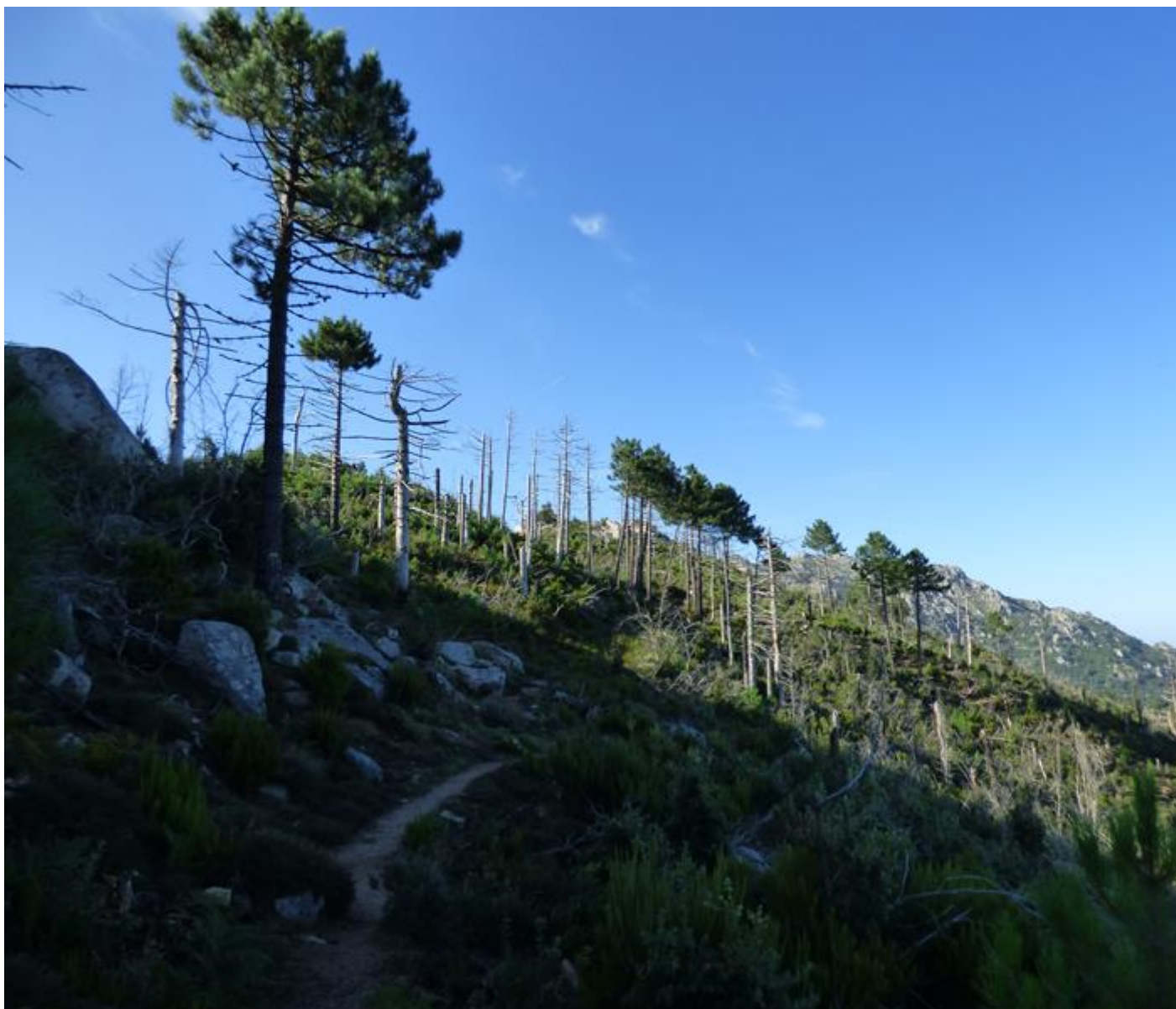
• In cima si ponu vede e vistiche di un focu di u 2009