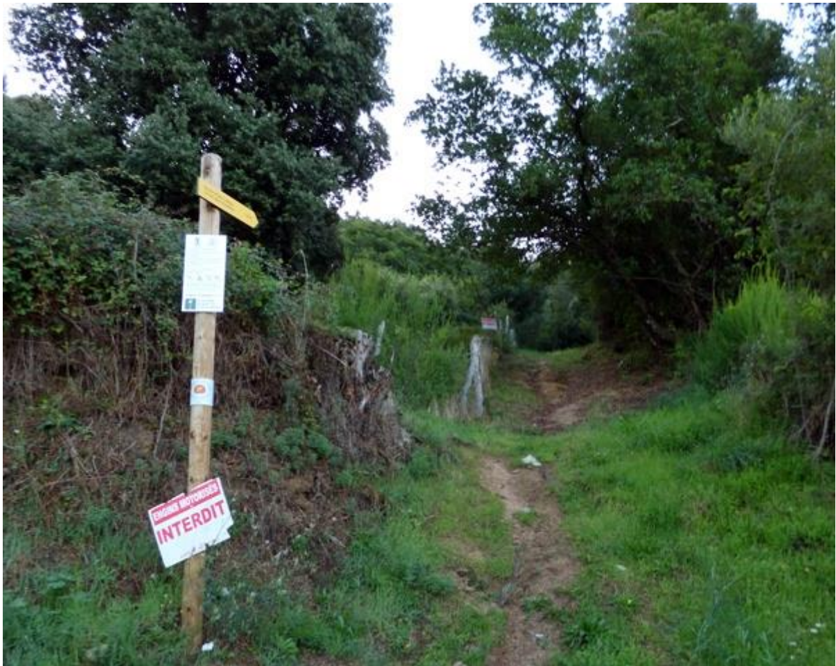
• U principiu di u chjassu

U Monte San Petru ci porghje un panorama chì ci laca una stampa prufonda in a mente. Hè dinù ch'ellu ci fù un fattu tragicu chì si ne vede e vistiche in cima.