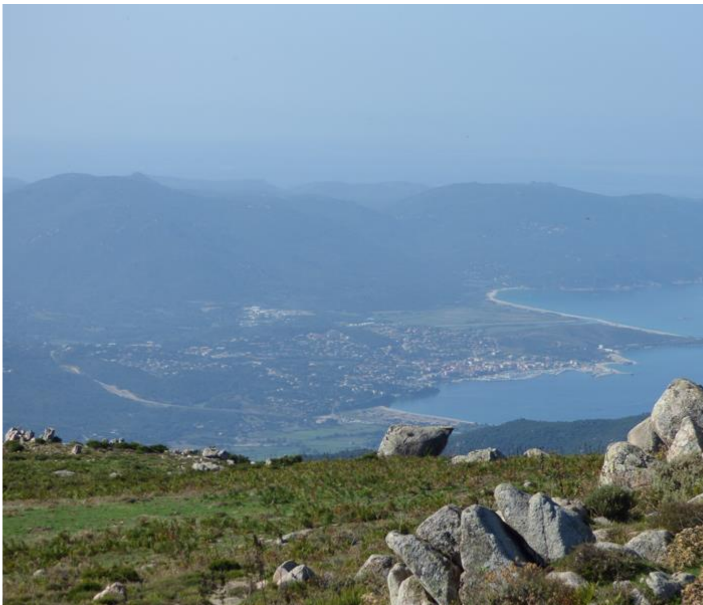
• Vista nantu à Prupia