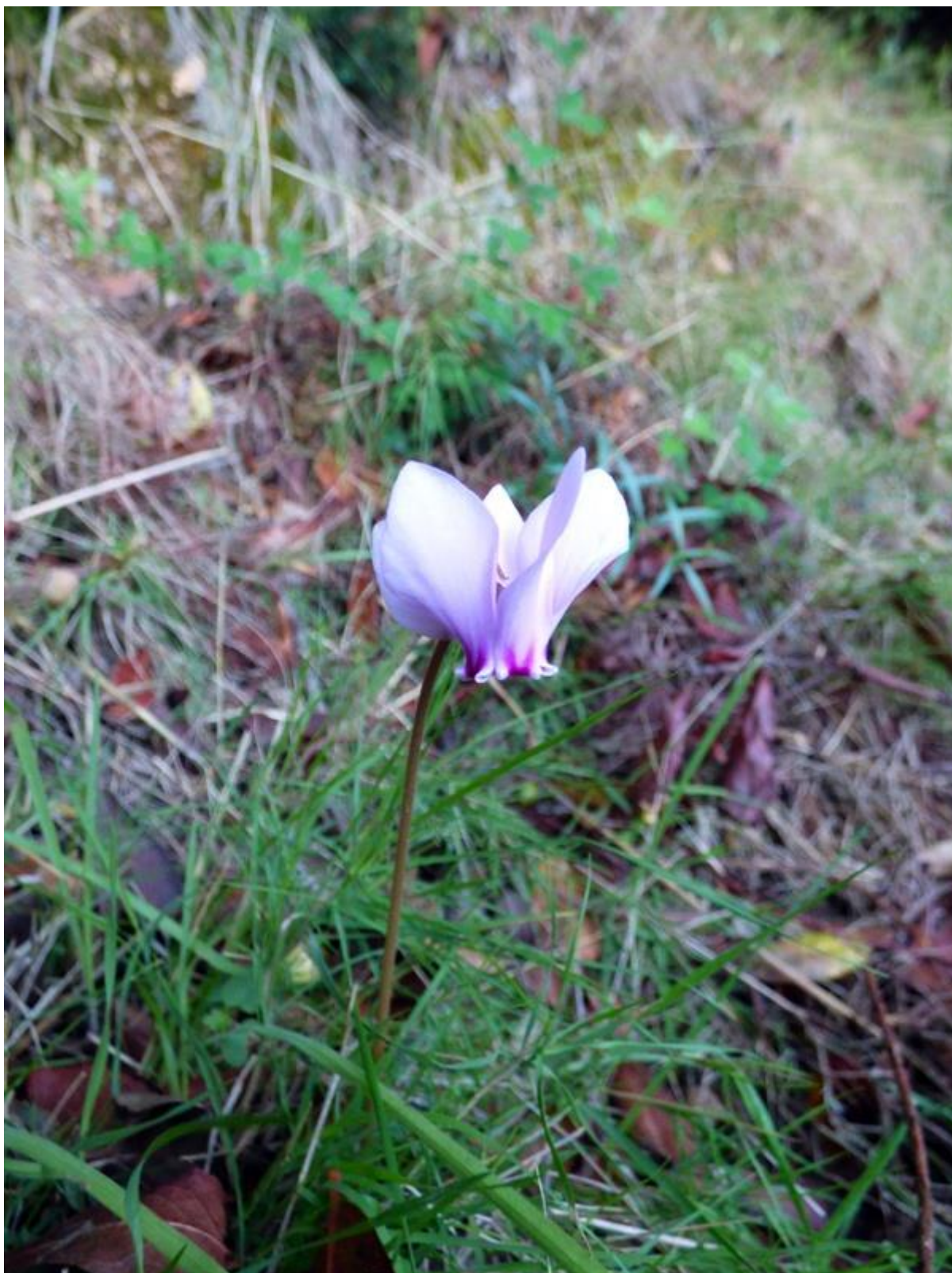
• Un cuccu