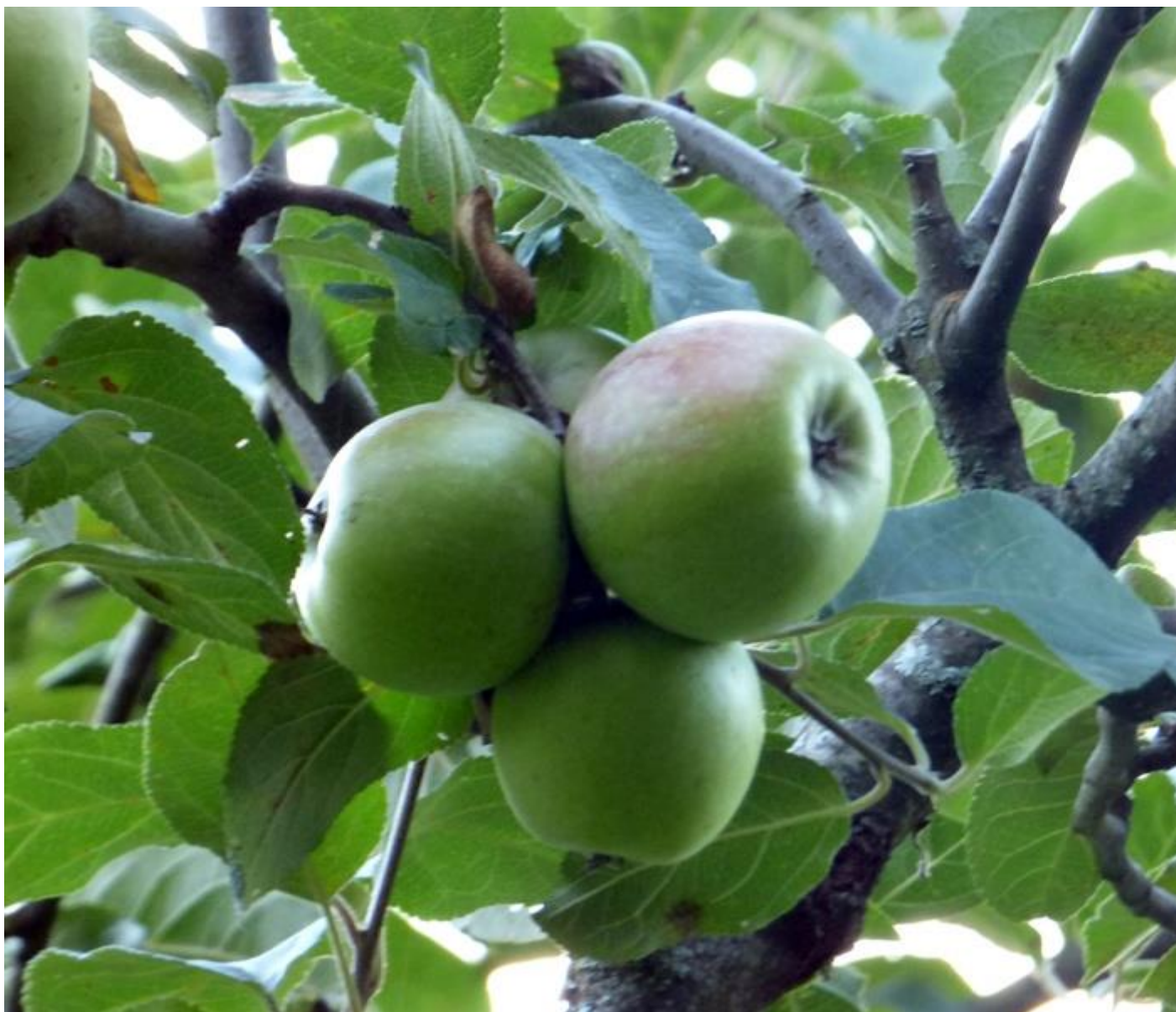
E mele !