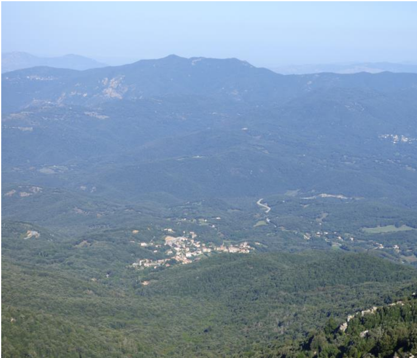
• Vista nantu à U Pitretu è Bicchisgià

I blocchi granitichi chì facenu a punta di u monte San Petru danu un panorama tremendu di u Meziornu estremu di l'isula.