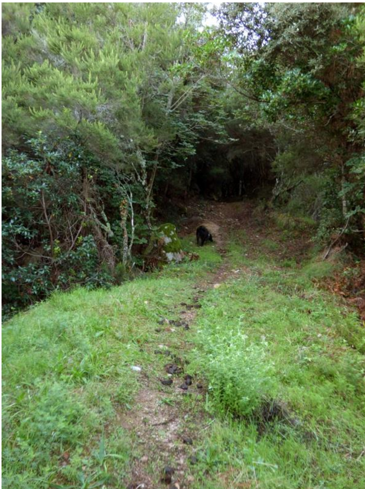
• U principiu di u chjassu