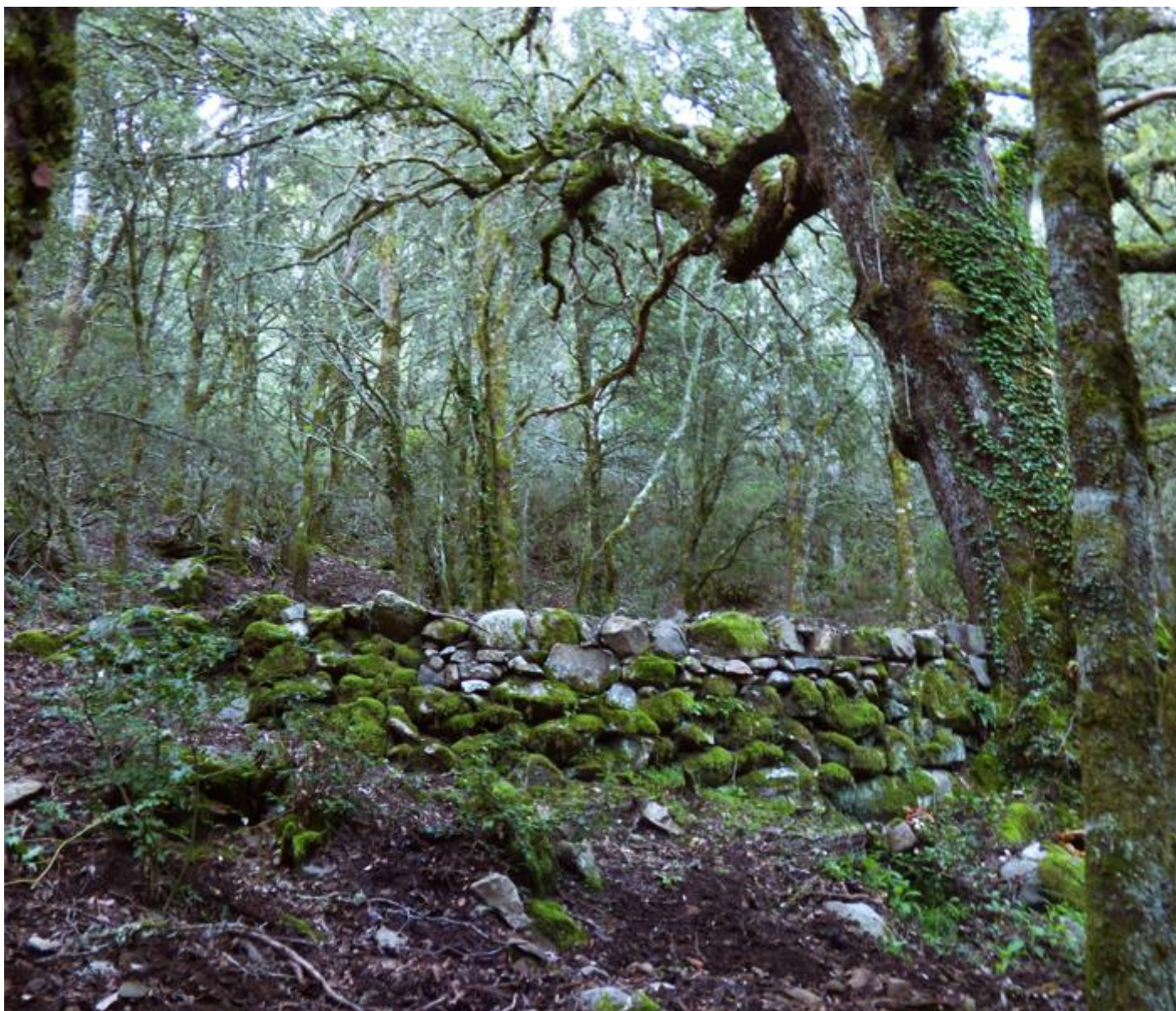
• Vistiche di un'attività economica