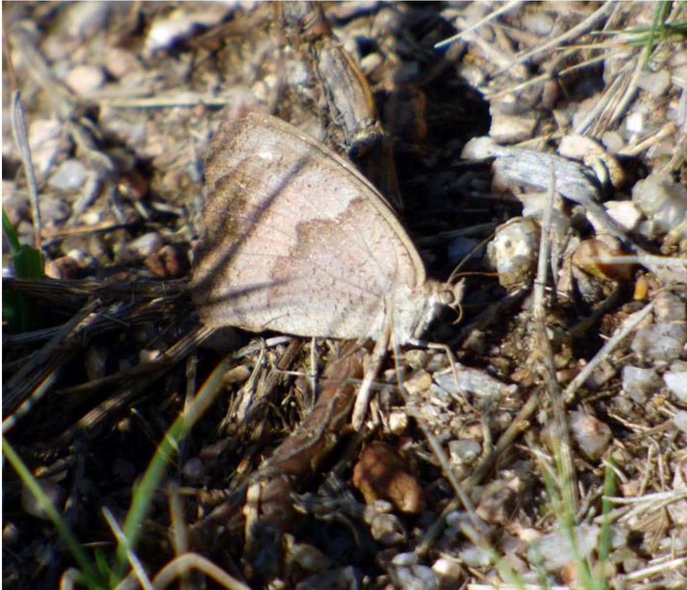
• Una farfalla