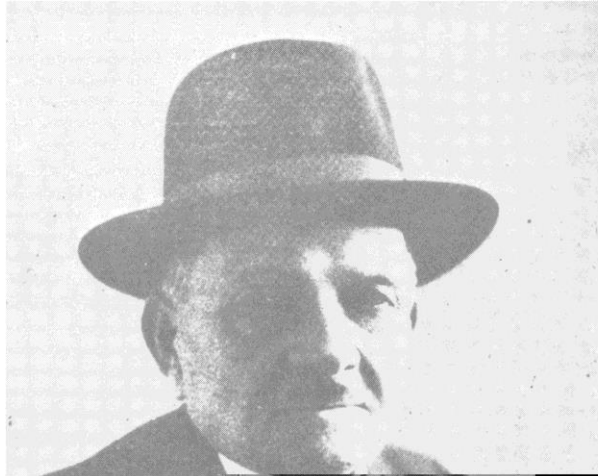
23. Santu Casanova, der Begründer der korsischen Schriftdichtung und Felibrebewegung, Verfasser der „Sirinata di Spanettu“.