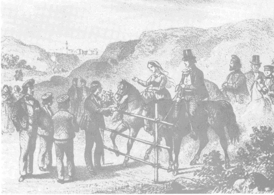
21. Hochzeit 3 : Die „Travata“. Aus Abbe Galletti: Histoire de la Corse . 1863.