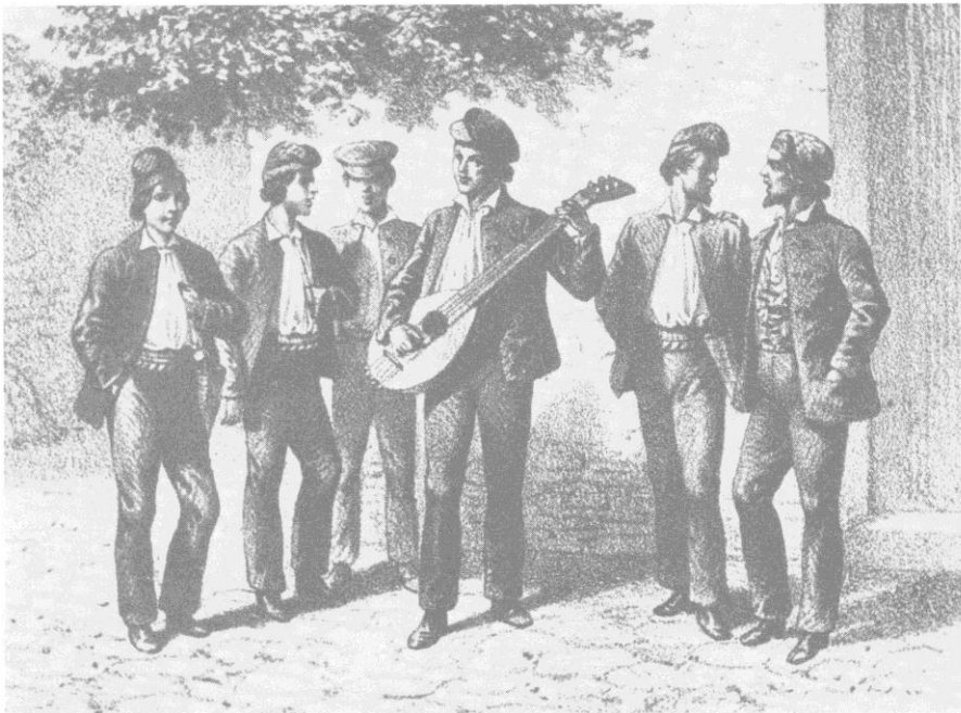
18. Serenade . Aus Abbe Galletti: Histoire de la Corse . 1863.