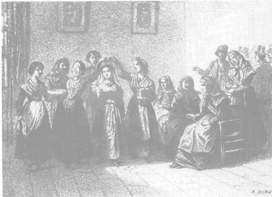
22. Hochzeit 4 : Die „Bonaventura“. Aus Abbe Galletti: Histoire de la Corse . 1863.